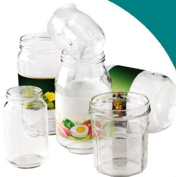
Pots et bocaux